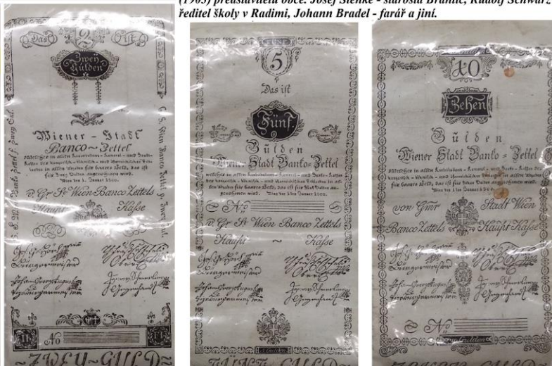
První papírové peníze, bankovky, používané na našem území. Zde v hodnotě 2, 5 a 10 guldenů (zlatých) z roku 1800.