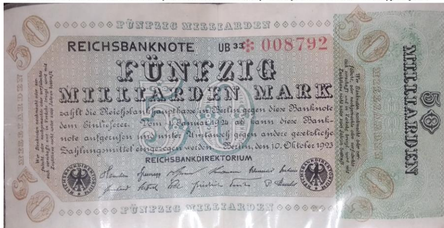
Bankovka v hodnotě 50 miliard říšských marek z roku 1923, kdy v tehdejším Německu vrcholila hyperinflace.

dnešním Maďarsku) z roku 1763, tedy z doby panování Marie Terezie. Následovaly drobné mince (krejčary) z první i druhé poloviny 19. století. Téměř největší mincí celého souboru je stříbrná pětikoruna z roku 1900 (váha 24g, průměr 36 mm). Zastoupeny byly i mince z období meziválečného