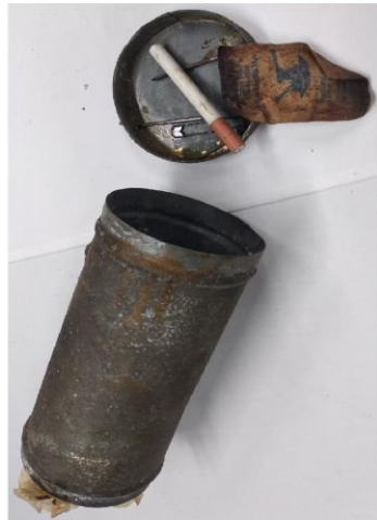
Mladší z obou tubusů obsahoval poměrně raritní předměty - sáček s cukrem, zavírací špendlík a tužku v podobě cigarety.