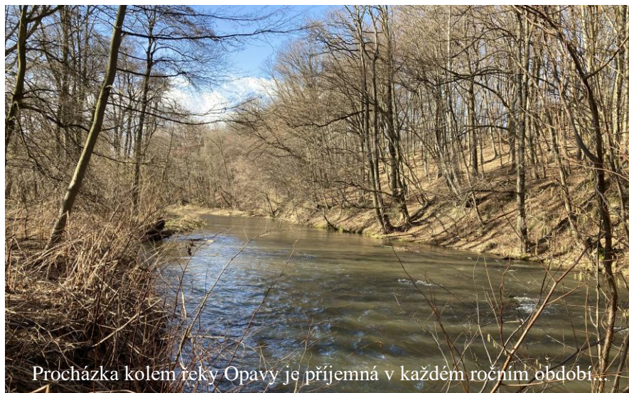
Procházka kolem řeky Opavy je příjemná v každém ročním období.

V budově sociálního zázemí TJ Sokol Brantice se dokončí rekonstrukce sociálního zařízení. MŠ Brantice se vybaví novými herními prvky. Na kostele se provede generální oprava věžních hodin (termín do 30.4.2022). V tomto roce byla vyhlášena 4. výzva na kotlíkové dotace v Moravskoslezském kraji. Obec poskytne k tomuto projektu finanční příspěvek z rozpočtu obce na jeden úspěšný projekt 5 000,- Kč, celkem ve výši 150 000,- Kč. Z důvodu vysoké inflace, zdražení výrobků a služeb v r. 2022, ZO rozhodlo navýšit nenávratný finanční příspěvek v programu na